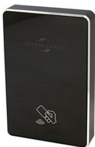
AR100-EH black / AR101-MF black