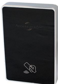
AR100-EH silver / AR101-MF silver